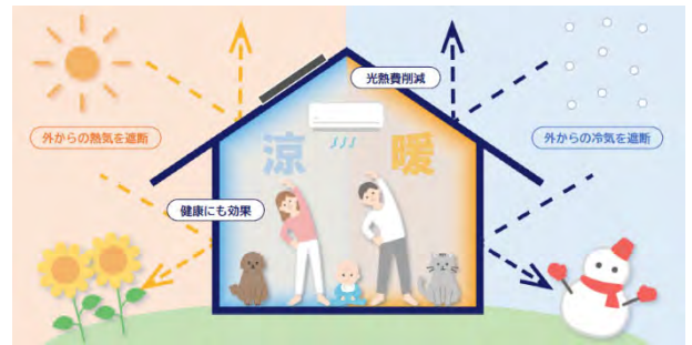
最高レベルの断熱性能を備えた省エネ住宅のイメージ

※1 令和7年2月28日までに所有権保存又は移転の登記申請、令和6年4月1日以降令和7年2月28日までの間に対象住宅の所在地に住所を有する者として住民登録の届出を行うこと。